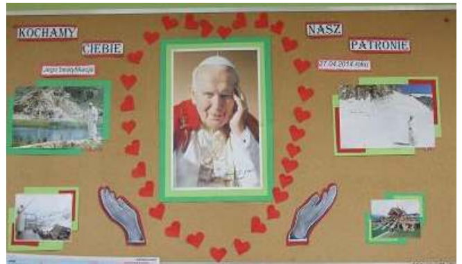
Spektaki „Recepta na Świętość według Jana Pawła II”