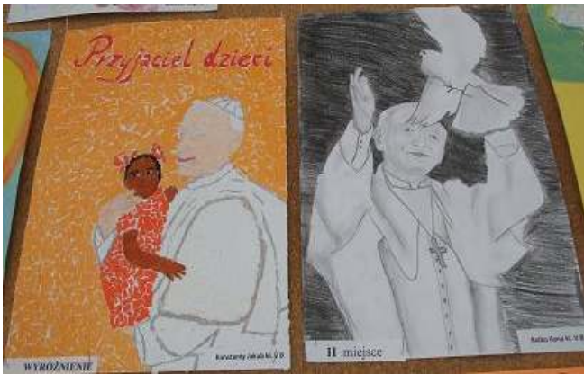
Gazetki szkolne i klasowe