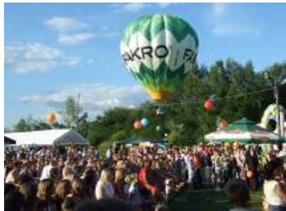
Dla uczestników festynu przygotowywanych jest szereg atrakcji.